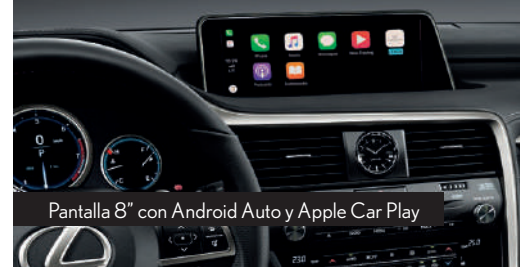
Pantalla 8" con Android Auto y Apple Car Play